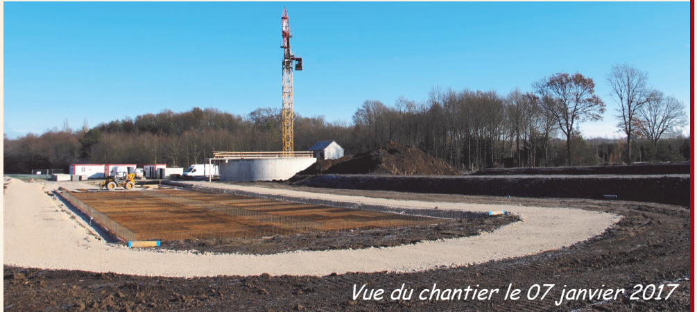
Vue du chantier le 07 janvier 2017

Le bassin de lagunage de 2000m 2 est fini à 90%. Il permettra de stocker l'eau en sortie de station lorsque le niveau du Gué Richoin et de la Bonnée seront bas durant la période estivale. Le terrassement des bassins à macrophytes (roseaux) est achevé et le ferrailage est en cours avant que soit coulé le béton.