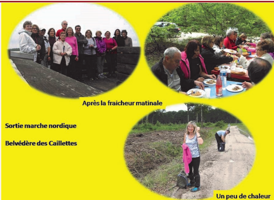
Après la fraîcheur matinale

Afin de ne pas surcharger les sorties il est obligatoire de s'inscrire.