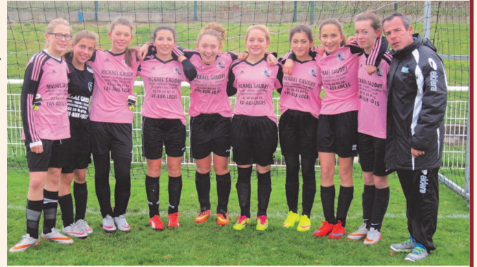
L'équipe U15F championne