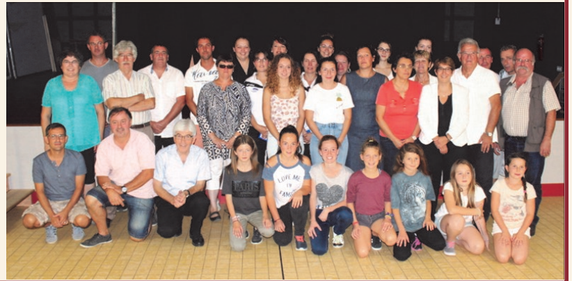
Remise du trophée féminin