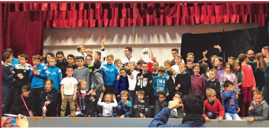
Arbre de Noël du RCBB