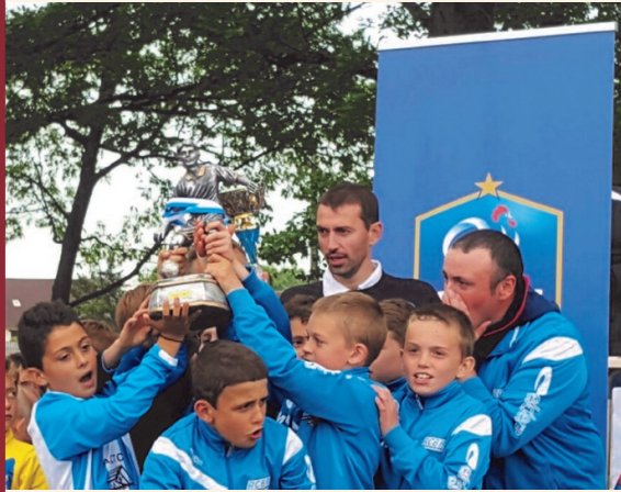
Tournoi de Pentecôte