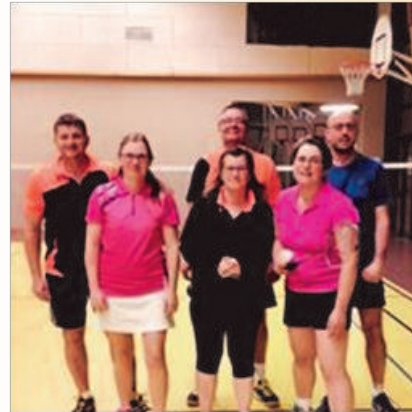
Notre équipe D3

Le 09 décembre dernier, s'est tenu comme chaque année le Tournoi Départemental Jeunes qui a réuni 133 jeunes de poussins à juniors.