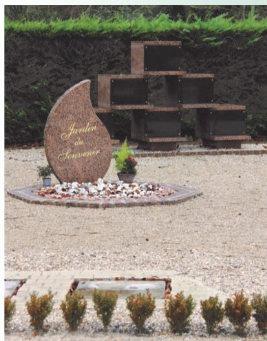
Un cavurne (au premier plan), le jardin du Souvenir (dispersion des cendres au centre) et le columbarium (en arrière plan)

De nouvelles places dans la partie columbarium du cimetière seront installées au cours de l'année 2019.