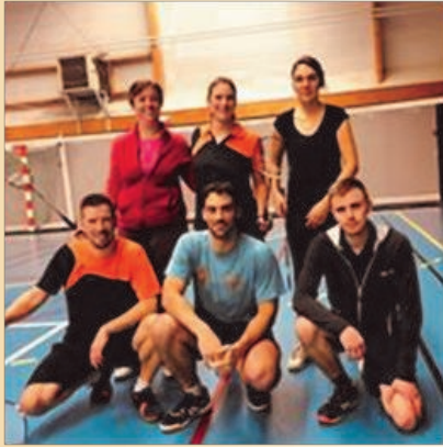
Notre équipe D4

Le BCLB est entré dans sa 17 ème saison. Cette année nous avons à nouveau deux équipes engagées en interclubs départementaux.