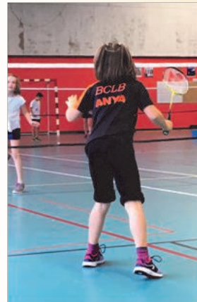
Nos jeunes en plein effort

Le 09 mars 2019, le club organise sa traditionnelle « Nuit du Bad » ouverte aux licenciés des clubs environnants, les badistes s'affrontent dans le noir sous des lumières noires, les tenues fluo sont évidemment de rigueur.